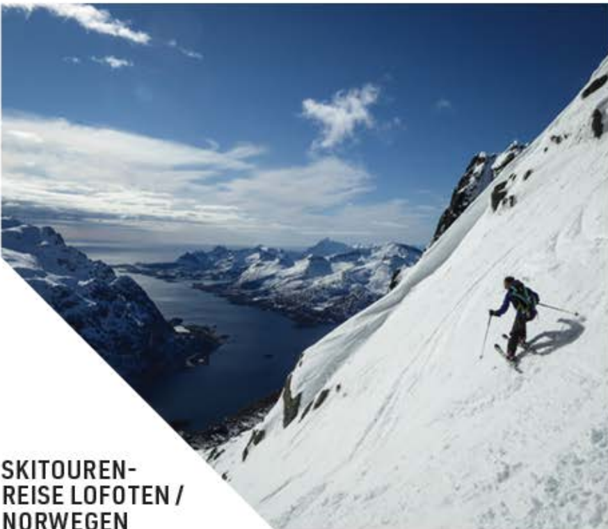
SKITOUREN- REISE LOFOTEN / NORWEGEN